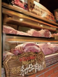
お店の扉を開くと、最高級 のお肉が歓迎してくれます。