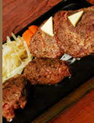
ランチタイム トリプル ステーキ 350g