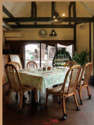
ご家族の利用に人気の テーブル席です。