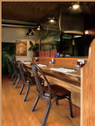
カウンターもありますので、お一人でも気兼ねなく お越し下さい。