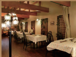
ひろびろとした店内は、ご家族や グループの利用におすすめです。