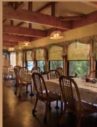
店内はひろびろ 50 席 ございます。