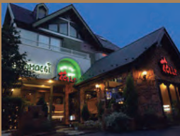
首都高速高架下の本蓮 (ほんばず) 交差点にあります。