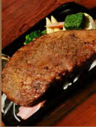
ランチタイム 黒毛和牛 サーロインステーキ